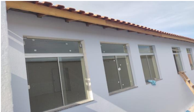
1 Pintura e acabamentos finais