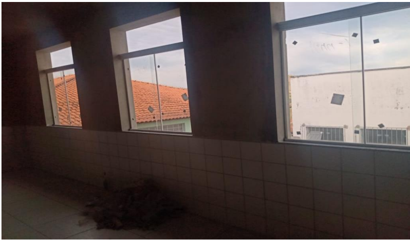
5 – Preparação para pintura interna