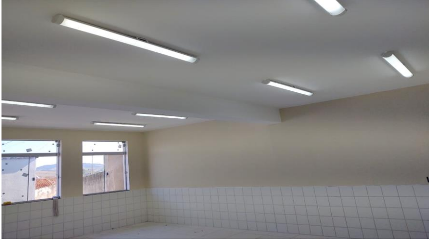
4 Pintura interna, instalações elétricas.