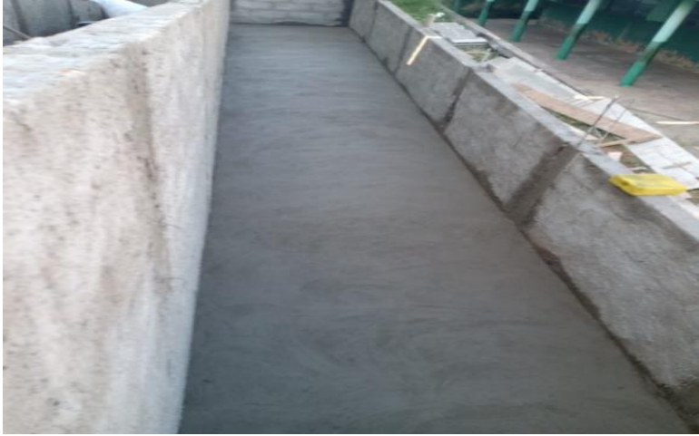
7 – Rampa terminada.