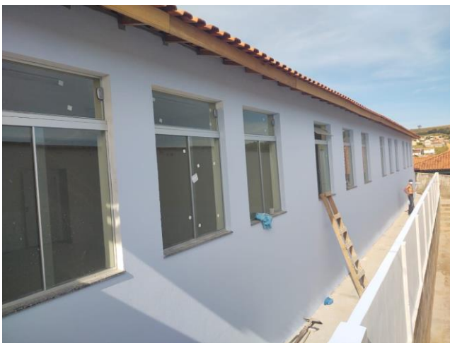
2 – Pintura Externa